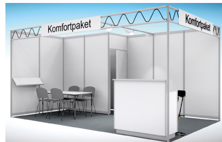
Abbildungen: Musterzeichnung Eckstand 15 m 2

Dieses Paket ist auch als Basispaket ohne Standreinigung und Möblierung sowie ohne Garderobenleiste und Prospektablage erhältlich.