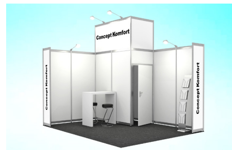
Abbildungen: Musterzeichnung Eckstand 15 m 2

Dieses Paket ist auch als Concept Basis ohne Standreinigung und Möblierung sowie ohne Garderobenleiste erhältlich.